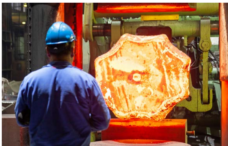
Na začátku prosince proběhlo u hydraulického lisu CKV 2250 kování výkovku bloku o rozměrech 810 x 410 x 4330 mm. Výchozím polotovarem byl ingot 8K17 o vložené hmotnosti 14 550 kg z nástrojové oceli 21MnCr5.