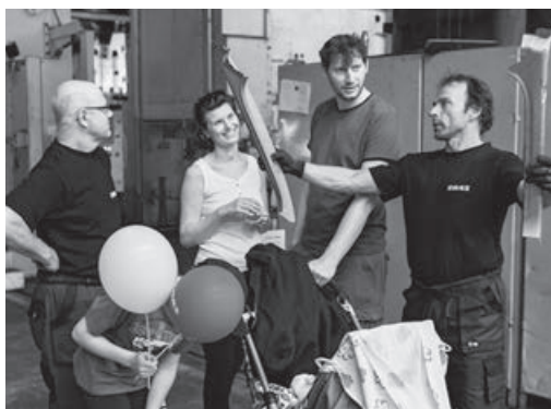
Malí i velcí měli jedinečnou příležitost dozvědět se víc o tom, co firma ŽDAS vyrábí a jak ve skutečnosti vypadají její provozy.

Organizátoři děkují všem, kteří se na přípravě Dne otevřených dveří podíleli, zvláště poděkování patří skvělému týmu firemních hasičů. Především ale děkujeme těm, kterým byla akce určena, malým i velkým návštěvníkům, za jejich trvalý zájem a blízký vztah k firmě, která je už po tolik desetiletí pevně spjatá s městem Žďar nad Sázavou i s regionem Vysočiny. Už nyní se těšíme na setkání příští rok ve stejném termínu!