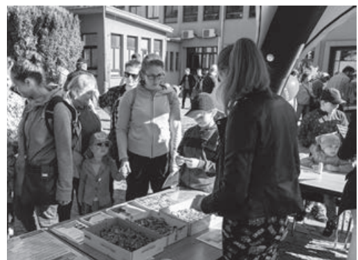
Pro více než pět tisíc návštěvníků byla připravena řada soutěží a upomínkových předmětů.