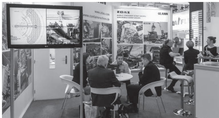
Náš stánek na veletrhu IFAT v Mnichově navštívilo v minulém týdnu od 14. do 18. 5. velké množství zájemců o zařízení na zpracování kovového šrotu.

V příštím čísle přineseme čtenářům podrobnější informace o právě proběhlém veletrhu Metalobrabotka v Moskvě a o dalších veletrzích, na kterých se firma ŽDAS představí v průběhu června.