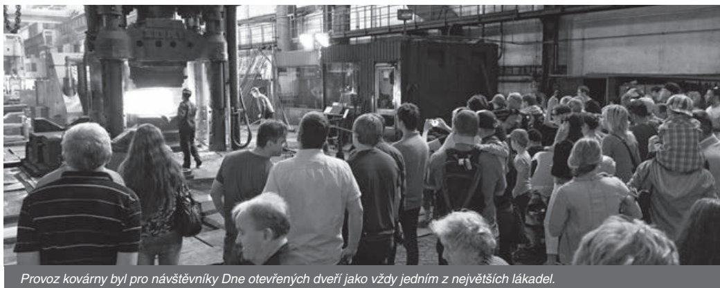
Provoz kovárny byl pro návštěvníky Dne otevřených dveří jako vždy jedním z největších lákadel.

Den otevřených dveří akciové společnosti ŽDAS, který se každoročně koná 1. května, předčil v letošním roce v mnohém všechny předcházející ročníky. Areálem firmy prošlo letos 5 135 návštěvníků, což je absolutní historický rekord.