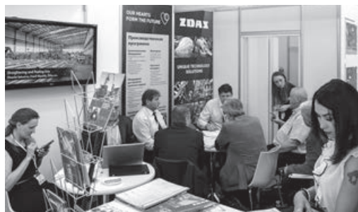
Během květnového veletrhu Metalloobrabotka v Moskvě se firmě ŽDAS otevřela celá řada velmi zajímavých obchodních projektů, které jsou předmětem právě probíhajících intenzivních jednání.

Mezinárodní veletrh Metalloobrabotka v Moskvě patří již tradičně několik let mezi nejvýznamnější strojírenské akce v celém Rusku i v okolních státech SNS. Letošní 19. ročník proběhl pod patronátem Obchodní průmyslové komory Ruské federace a byl podporován Radou federace Federálního shromáždění RF, Ministerstvem průmyslu a obchodu RF a několika oborovými svazy a asociacemi. V termínu od 14. do 18. května 2018 se akciová společnost ŽDAS již poněkolkáté představila na této výstavě v rámci společné expozice českých firem pod záštitou zahraniční kanceláře agentury CzechTrade. Veletrh Metalloobrabotka je v Rusku prá-