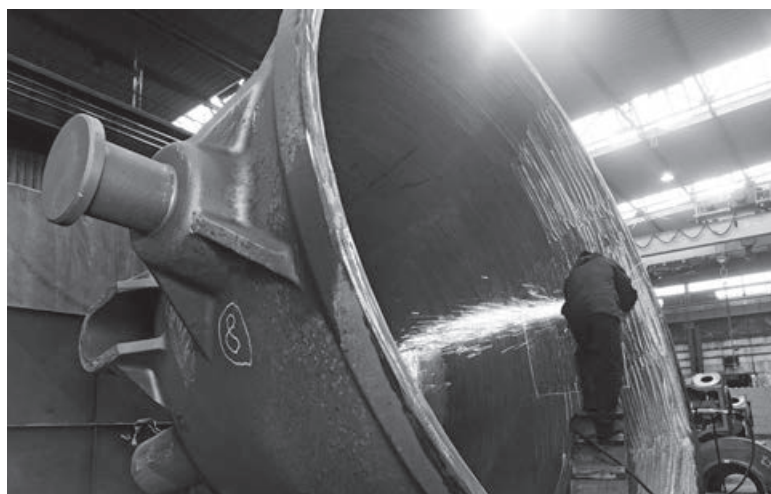
V provozu čistírny divize Metalurgie probíhá vybrušování vnitřního povrchu odlitku ocelové pánve pro přepravu tekuté strusky o objemu až 16,5 m 3 a hmotnosti odlitku 30 tun, určeného pro německého zákazníka CCE. Těchto pánví bude vyrobeno celkem dvacet, přičemž poslední pánev bude odlita v polovině června a bude dodána zákazníkovi koncem září 2018. Z uvedeného celkového množství jsou čtyři pánve již dodány a další dvě jsou připraveny k expedici.