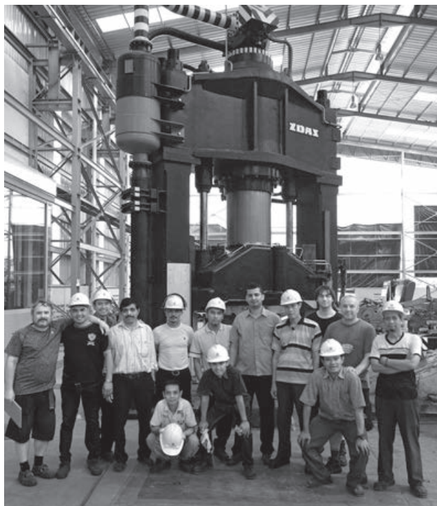
Pracovníci technického úseku provedli inspekci kovacího souboru, který byl loni zprovozněn u indonéského zákazníka.

Koncem května navštívili pracovníci technického úseku zákazníka v Indonésii, kterému byl v květnu loňského roku předán do užívání nový kovací soubor s lisem CKVX 1250, manipulátorem QKK 5 a ingotovým vozem QHK 5. Kovací lis CKVX 1250, původně z provozu kovárny metalurgie ŽDAS, byl v naší firmě modernizován, vybaven moderním jednotkovým olejovým hydraulickým pohonem a doplněn kovacím kolejovým manipulátorem a ingotovým vozem. Projekt, který zahrnoval výrobu zařízení, dodávku, montáž a oživení celého souboru včetně jeho pohonu, elektrozařízení, vizualizace a integrace, je pro ŽDAS zajímavou referencí na indonéském trhu, kde je náš zákazník, firma PT Mohgatech jedinou kovárnou. Hlavním účelem návštěvy našich specialistů bylo provedení roční technické inspekce a údržby na základě kontraktu. Zároveň se ale naši zástupci samozřejmě také na místě podrobně zajímali o to, jak zařízení funguje a jak je s ním zákazník spokojen. Celý kovací soubor je po ročním provozu ve výborném stavu, zákazník jej pečlivě udržuje a s naším zařízením je velmi spokojen. Dosud na našem kovacím souboru firma PT Mohgatech vykovala 1500 tun materiálu, většinu výkovek tvoří trubky a kroužky.