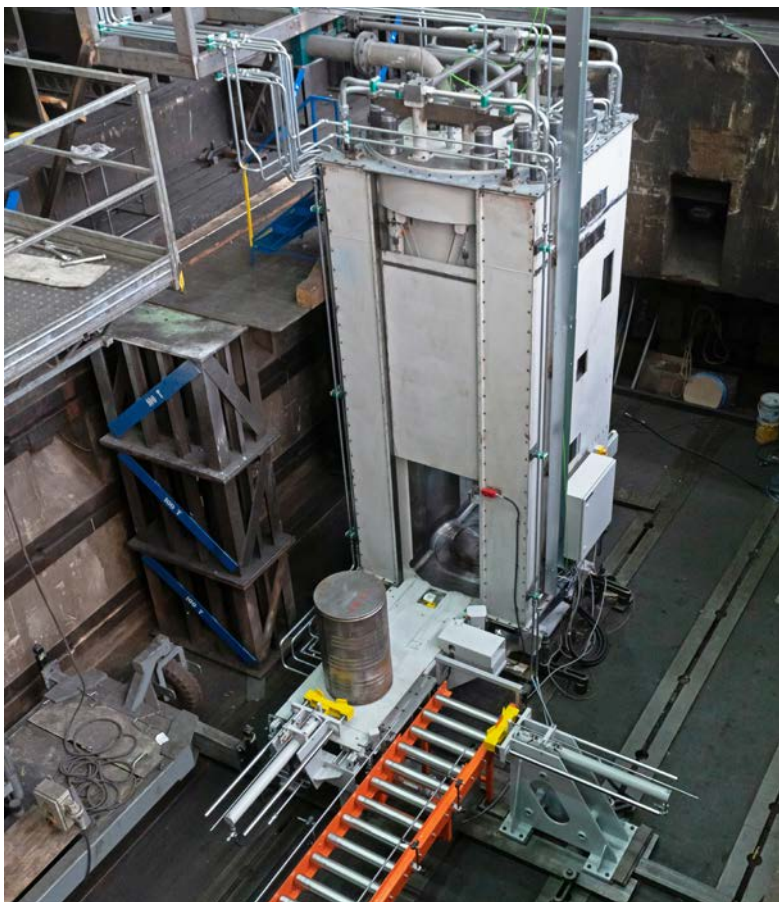
Lis HDP 2000 slouží pro zpracování tuhého sekundárního odpadu z jaderných elektráren.

V nadcházejícím roce oslaví společnost ŽĐAS výročí 70 let od zahájení výroby. Už nyní připravujeme pro zaměstnance a veřejnost atraktivní program oslav plánovaných na sobotu 28. srpna 2021 a můžeme prozradit, že jejich součástí bude kromě jiného také Den otevřených dveří, tentokrát tedy v netradičním termínu. Od ledna budeme čtenářům během celého roku 2021 přinášet v každém čísle Žáru nějakou zajímavost z historie společnosti. V úvodu tohoto výročního seriálu si připomeňme alespoň v krátkosti některá hlavní data o počátcích naší firmy.