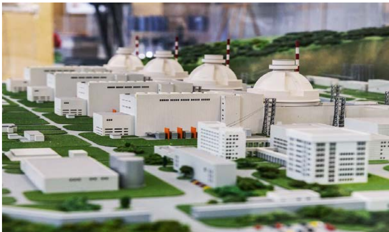
Vizualizace podoby nově budované jaderné elektrárny Akkuyu v Turecku, kde bude náš lis zhutňovat sudy s kontaminovaným odpadem.

V listopadu jsme podepsali kontrakt s naším dlouholetým odběratelem, firmou Nukem se sídlem v Německu, na dodávku vysokotlakého lisu HDP 2000, který slouží k lisování sudů naplněných kontaminovaným odpadem. Jedná se o projekt zpracovatelského centra pro aktuálně stavěnou jadernou elektrárnu Akkuyu v Turecku. Generálním dodavatelem celé stavby je ruská společnost Rosatom, která nejenže dodá technologii jádra a výstavbu bloků, ale jadernou elektrárnu bude několik let i sama provozovat a zároveň školit specializovaný personál z turecké strany.