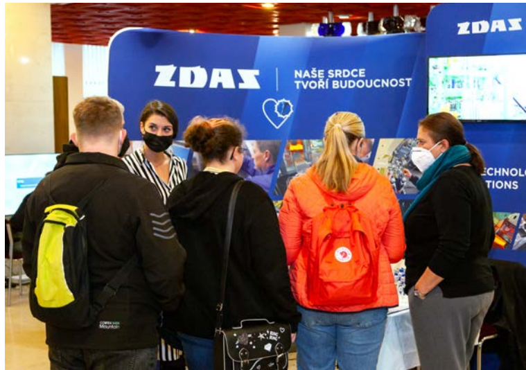
Festival vzdělávání ve Žďáře nad Sázavou

Nový školní rok s sebou přináší nelehký úkol pro studenty základních, středních i vysokých škol. Je na nich, aby si zvolili další směr ať už pracovní, či studijní. Proto se během října a listopadu uskutečnilo několik akcí, během kterých se mohli studenti informovat o možnostech praxe, stáže, brigády či získání stipendia.