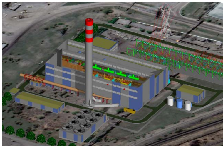
3D model objektu elektrárny, která by měla být dokončena do konce roku 2024. Nyní probíhají přípravné práce pro zahájení stavby.